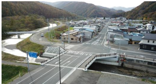
平成29年度優良県営建設工事受賞 一般国道340号元町橋架替工事 (ドローン空撮)

主に岩手県、葛巻町、雫石町発注の道路、河川、水道、農業土木、治山、林道などの工事を手がけています。