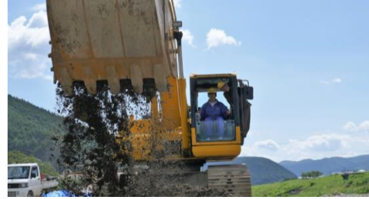
インターンシップ風景