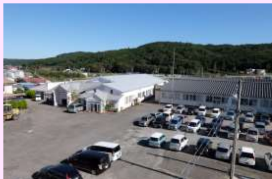
▲岩手モリヤ株式会社 本社外観

久慈東高等学校 大野高等学校 久慈工業高等学校 種市高等学校 久慈高等学校 葛巻高等学校 久慈拓陽支援学校