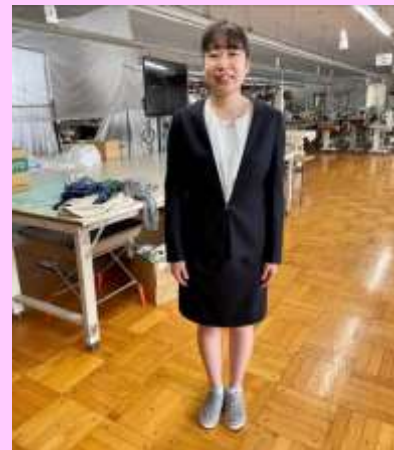
▲入社後2か月で縫製した自分のオーダースーツ。先輩の指導のもと、自分の寸法に合わせて自らが作りました。