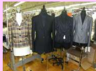
▲当社で縫製した製品