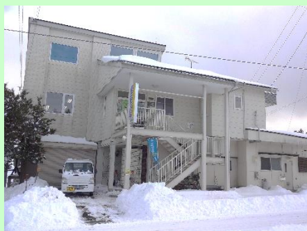
▲林崎建設株式会社 本社外観