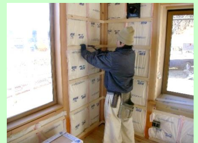
▲壁の下地作業をしているところ

また、敷地の土留めや基礎工事で、コンクリートを流し込むための型枠作りも行います。