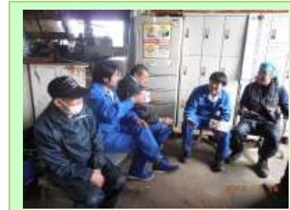
▲休憩中に先輩方と談笑