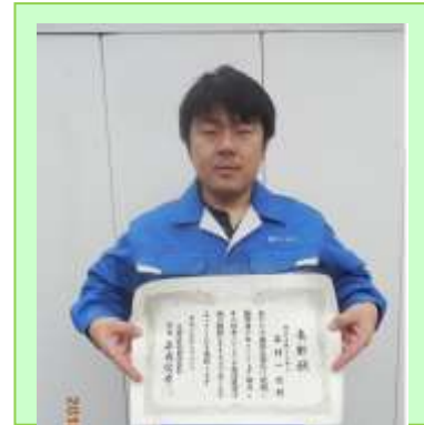
▲優良勤労青少年表彰！

1つ1つの作業を大切に、確認しながら作業する事を心がけています。そして、安全に正確に作業をする事で、製品の質を上げ会社に貢献できればいいなと思い、日々、頑張っています。