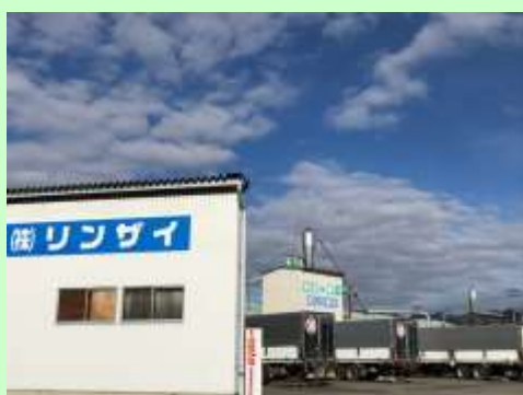
株式会社 リンザイ 外観