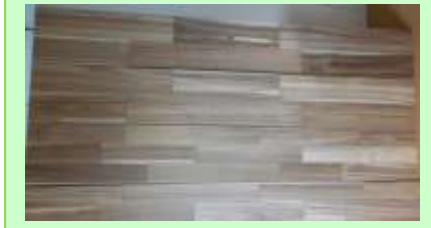
▲ 出来上がった床板材