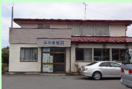
▲山口建設株式会社 本社外観