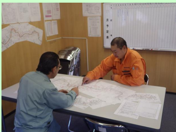
▲現場事務所での打ち合わせ。