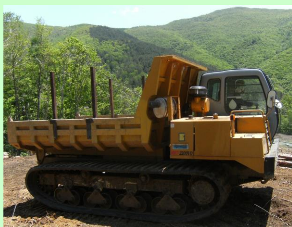
▲キャタピラー運転