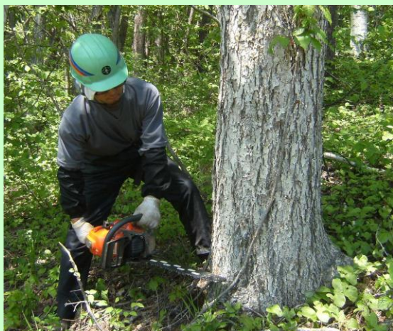
▲伐採作業(チェーンソー)