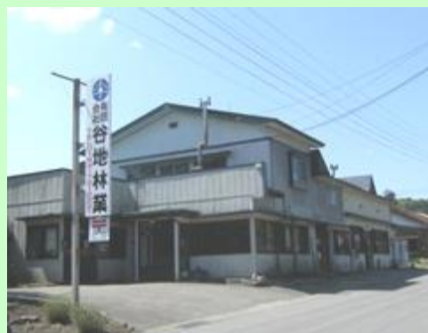
▲有限会社谷地林業 本社外観