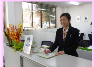
▲窓口対応をしているところ

私は人見知りなので、コミュニケーションを取るということが苦手でした。仕事を始めてからは、接客が主なので、徐々にコミュニケーションが取れるようになりました。仕事をするという事は、日々勉強なので、自分自身、成長できるように努力しています。失敗を恐れずに、何度でもチャレンジする気持ちも大切です。