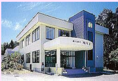
▲株式会社細谷地 本社外観