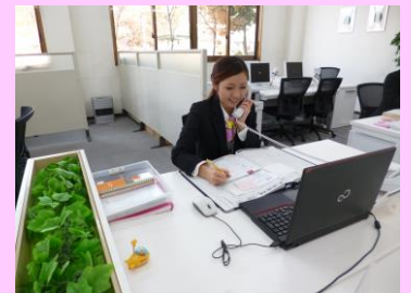
▲電話対応しているところ

出勤後、清掃、電話対応、接客等をしています。 他にも商品の発注、在庫管理、伝票入力、請求書のチェック作業等の業務を行っております。