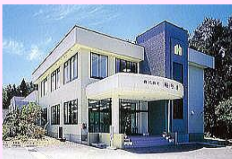
▲株式会社細谷地 本社外観