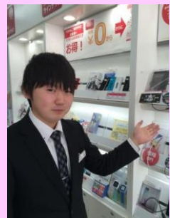
▲フロアでお客様をお出迎え