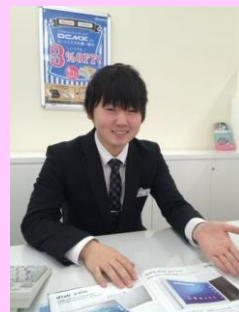
▲商品説明をしているところ