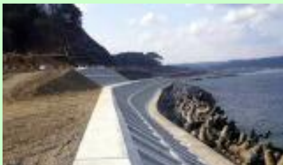
▲久慈応急復旧工事-法枠工事（野田村）