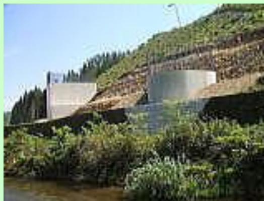
▲羅賀高架橋下部工工事-橋脚工事（普代村）

※橋台とは橋梁の両端にあって、取り付け道路と橋梁を接触し、上部構造からの荷重および背面盛土からの土圧荷重を支持する下部構造のこと