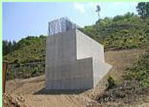
▲羅賀高架橋下部工工事-橋台工事（普代村）

※橋台とは橋梁の両端にあって、取り付け道路と橋梁を接触し、上部構造からの荷重および背面盛土からの土圧荷重を支持する下部構造のこと