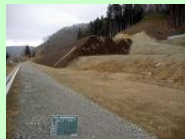
▲函渠を埋めた道路。函渠は道路下に埋設し、主に下水及び排水用管路として使用されています。