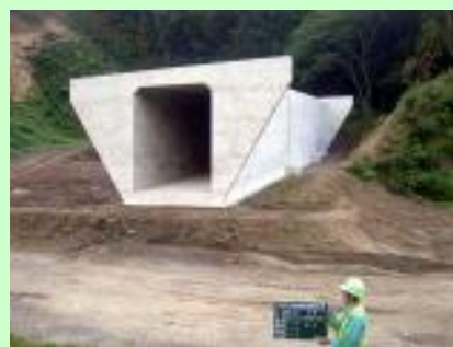
▲正面から見た函渠