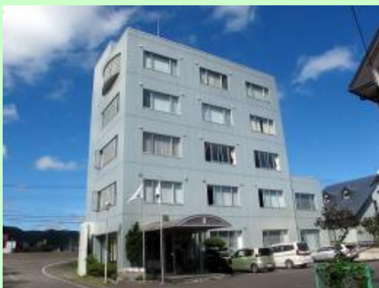
▲北星鉱業株式会社 本社外観

一言メッセージ 岩手・久慈地方の復興を自分の手でやってみよう! やってやる! というやる気のある若者を歓迎します!!