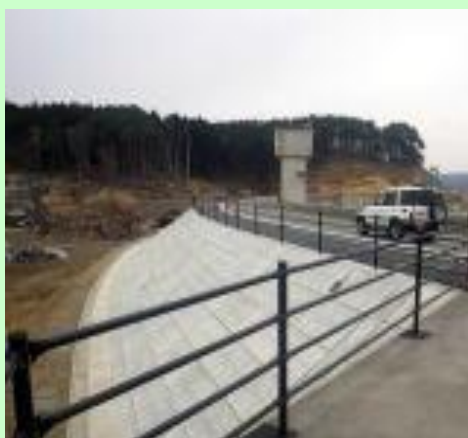
▲久慈応急復旧工事-法枠工事（野田村）