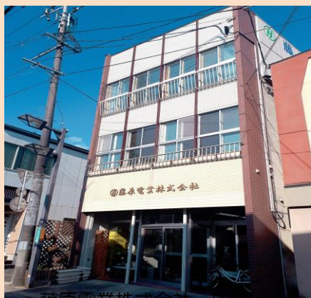
藤原電業株式会社 外観