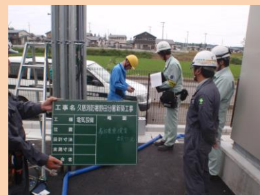
▲作業終了時の点検の立会い