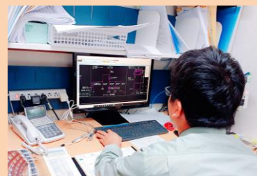
▲ソフトを使用した図面作成

担当する工事現場に出向き、お客様や建築会社・設備会社の方々と打ち合わせをして、工事の竣工（工事の完成）まで進めています。