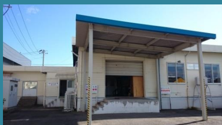
▲ 株式会社 七星 外観