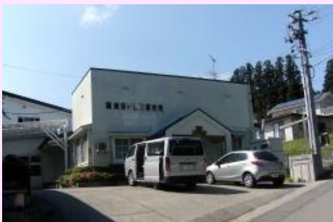
▲株式会社東京ドレス研究所 外観

見学は随時受け付けます！繁忙期・閑散期がありますが、状況によりインターンシップの受入れも可能です！！