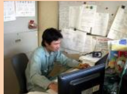
▲図面作成をしているところ