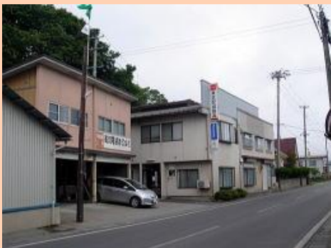
▲ 高畑電機株式会社 本社外観