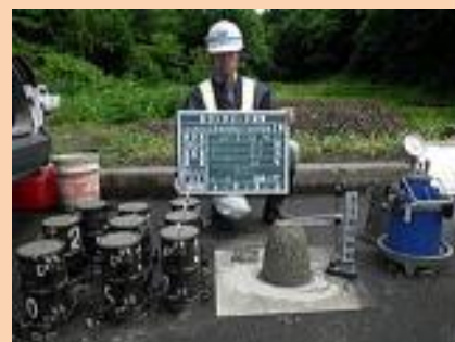
▲現場立会いをしているところ

※出来形とは、施工済みの箇所が設計図に示す形状寸法に対して適格かどうかを検査すること