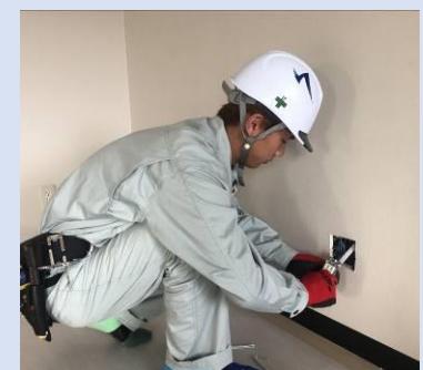
【コンセントの取付作業】

入社のきっかけは、地元就職かつ手に職がつく仕事をしたいと思ったからです。日々の仕事を頑張り、先輩方の技術を見習いながら努力しています。また、資格取得にも力を入れ、会社や自分の為になるように頑張っています。休日は釣りをしたりしています。