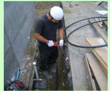
▲ポリエチレンパイプ(PP)切断

入社のきっかけは、力作業などの仕事は誰にも負けない自信があったからです。体を動かすことが好きで仕事に活かせればと思っていました。業務には穴掘りなどがあり、体力的にきつい仕事ですけど、現在の仕事は私には合っている仕事だと思い頑張ってます。