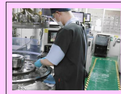
▲ 製品セット中その2