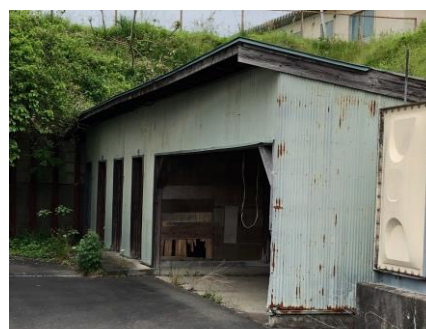
建物（物置）の戸が開いた ままとっている例