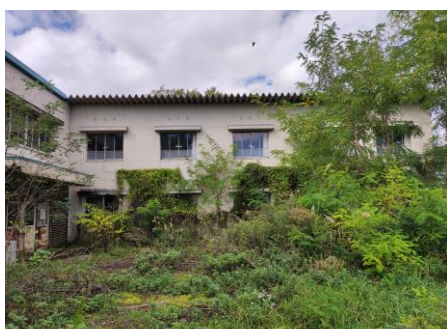
雑草や樹木が生い茂って 建物を覆っている例

令和3年3月31日現在の未利用資産144件について、必要な維持管理を実施しているかを把握するため、令和2年度中の現地確認の実施頻度を調査したところ、年に複数回実施しているものは96件、年に1回実施しているものは29件、実施していないものは19件であった。