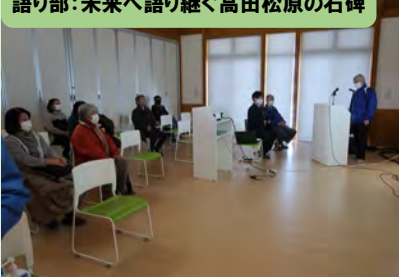
語り部：未来へ語り継ぐ高田松原の石碑