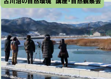
古川沼の自然環境 講座・自然観察会