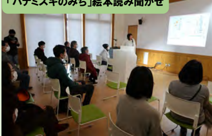
「ハナミズキのみち」絵本読み聞かせ