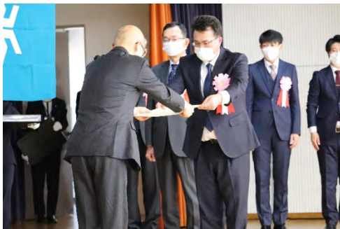
記念撮影 (優良下請負企業)