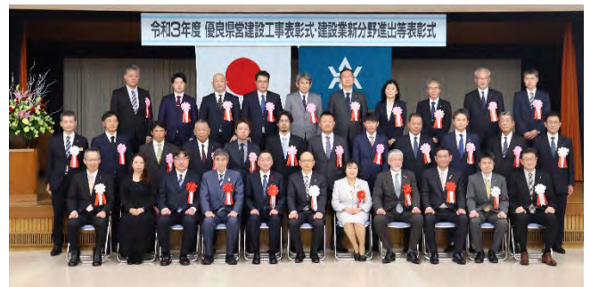
記念撮影 (建設業新分野進出等表彰)