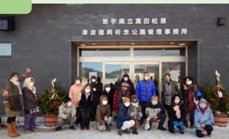
「未来へつなぐ 語り部の声」放映