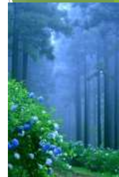
みちのくあじさい園