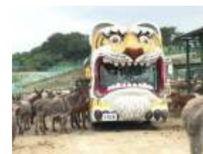
岩手サファリパーク