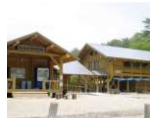
アストロ・ロマン大東