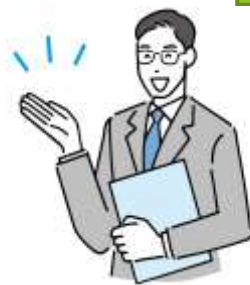
【案内サイン専門家】