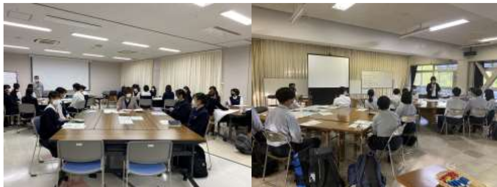
【市民ワークショップ】