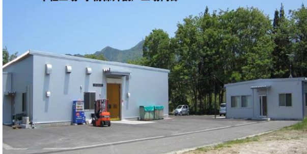
本社工場・事務棟外観/工場内部