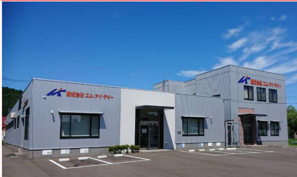
(株)エム・アイ・ティー会社紹介