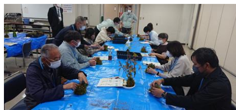
苔玉づくり講習会の様子