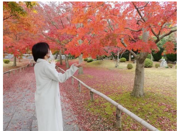
↑雨のちトメポーズ（雨がやんだかな？というポーズです）