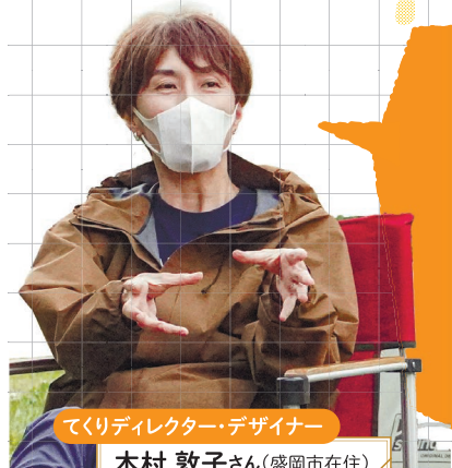
てくりディレクター・デザイナー