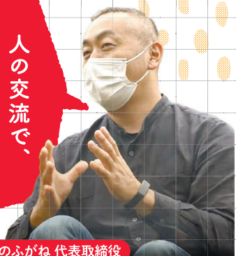
肉のふがね 代表取締役