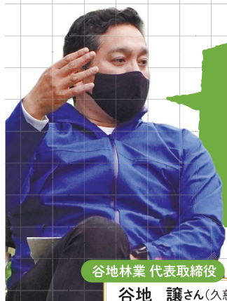
谷地林業 代表取締役