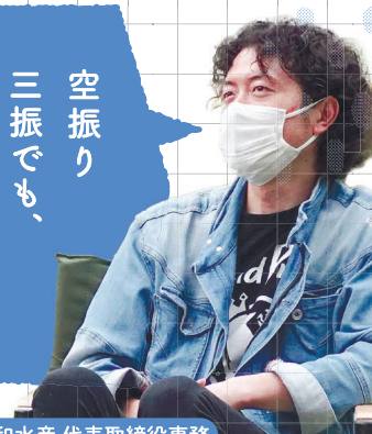
共和水産 代表取締役事務