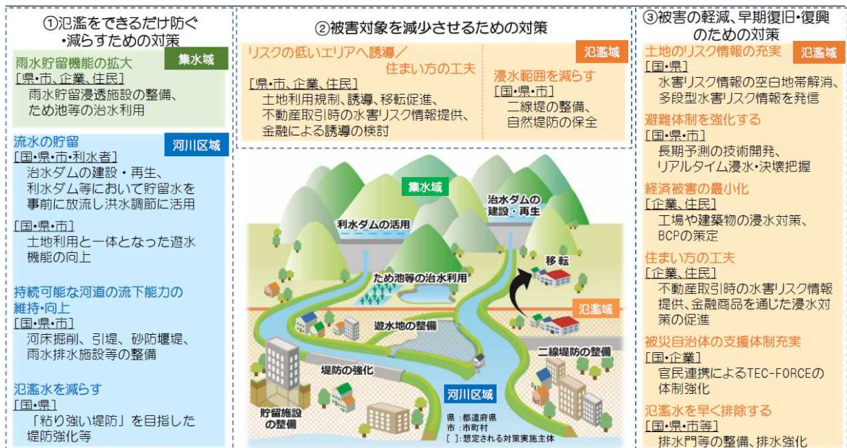
図. 流域治水の施策のイメージ (R2. 10. 28 流域治水の推進に向けた関係省庁実務者会議資料)