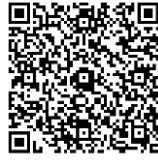
フェイスブックページ