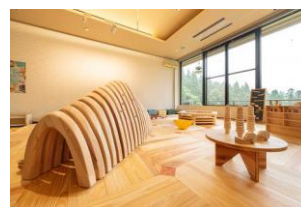
県産木材を使った木育広場