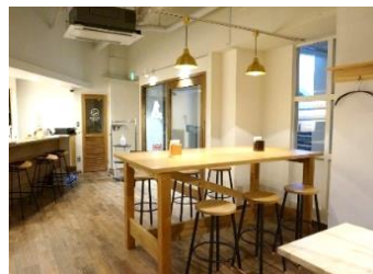
県産木材を使った店舗

・「いわて木づかいサポーター」として登録された工務店、製造業者等の情報を、県のホームページに掲載し、県産木材の利用に取り組む民間事業者に提供します。