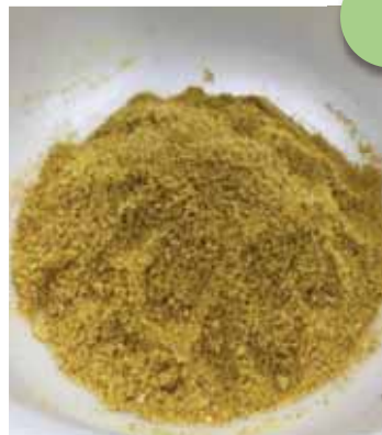
主に粉にして使用します

国産の和からしは大変貴重で、ほぼ国内には出回っていないとのことですが、平泉では昔から作られてきました。