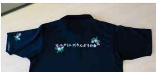
お揃いのポロシャツを作成！