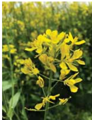
5月に花を咲かせる和からし

皮は、平泉産和がらしと南部小麦を混ぜ合わせた自然発色のからし色。てっぺんには、和がらしの粒をトッピングして、かわいさをまといました。肉あんは、肉汁あふれ出す中に、からしの辛さを上品に感じるように工夫し、具材には平泉の食材をふんだんに使用した、地元のおいしさをお届けする自慢の一品です。