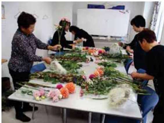
学ぶ機会を通じ交流を深め、会員で楽しく活動しています！

会を立ち上げたことで仕事に対する意欲が今まで以上に前向きに、そして、仲間同士の連携で今後の活動の幅を広げていけることに感謝です。活動の中で技術を磨き、りんどうで地域を活性化させることができればと思います。花のある生活で心が豊かになることを伝えていけたら幸いです。