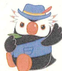
「エリカちゃん」のお友達の「エリオくん」