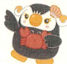
「エリカちゃん」のお友達の「エリナちゃん」

北方領土隣接地域※を訪問 する修学旅行を検討いただく ための、先生方を対象とした 下見ツアーです。