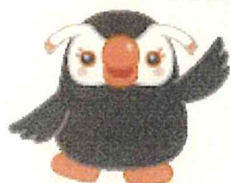
「エリカちゃん」 北方領土問題啓発キャラクター