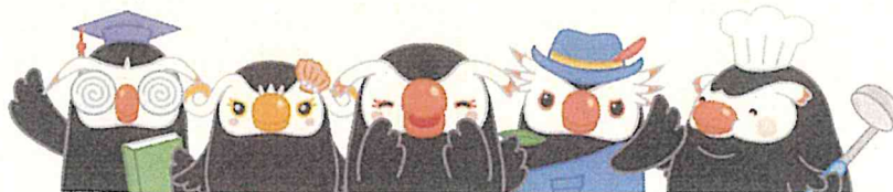
「エリカちゃん」とお友達