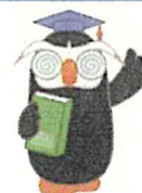
「エリカちゃん」のお友達の 「エリヨシくん」