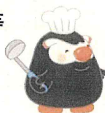
「エリカちゃん」のお友達の「エリマルくん」