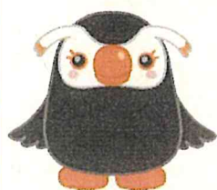
「エリカちゃん」 北方領土問題啓発キャラクター