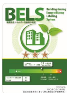
〔図 1〕 ガイドラインに基づく第三者認証の例

消費者への認知度向上を図るため、ZEHビルダー/プランナーをはじめとするZEHに関係する事業者は、インターネットやテレビ、雑誌等の広報媒体を介して、ZEHマーク〔図 2〕とともに光熱費低減やヒートショック関連の健康リスクの低減といったZEHのメリットを積極的に発信すること。