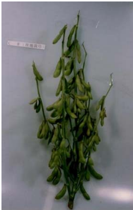
写真1 「ちゃげ丸」の草姿 (5月中旬播種 裸地栽培)

但し、蒸煮後の莢色がやや淡く、時間経過に伴って莢表面が部分的に黒ずんできてくる。