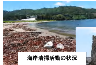
海岸清掃活動の状況