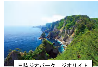
三陸ジオパーク ジオサイト の一例 北山崎（田野畑村）