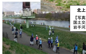
北上川一斉清掃の状況