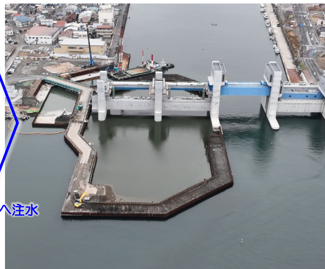
▲12月17日 締切内注水完了

令和4年度から進めてきました、Ⅱ期仮締切内での基礎杭414本、堰柱2本、カーテンウォール2径間、護床ブロック1,368個の施工が完了しました。