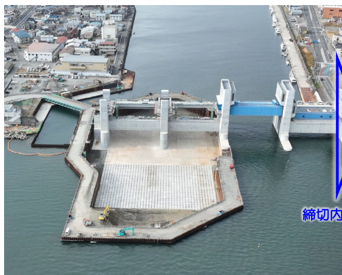
▲12月2日 Ⅱ期締切内工事完了