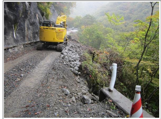
床掘り状況 遠野側より