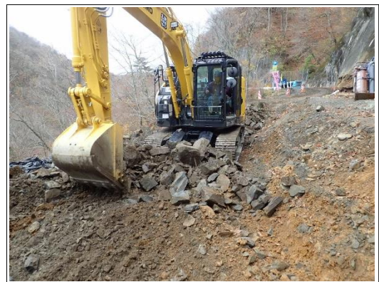
床掘り状況 金石側より