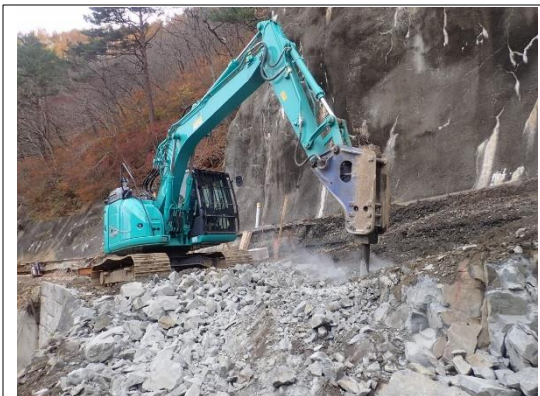
既設擁壁取壊し状況