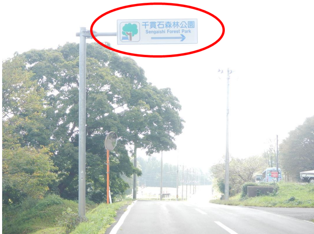
道路標識(県道 37 号線沿い 北上市側)