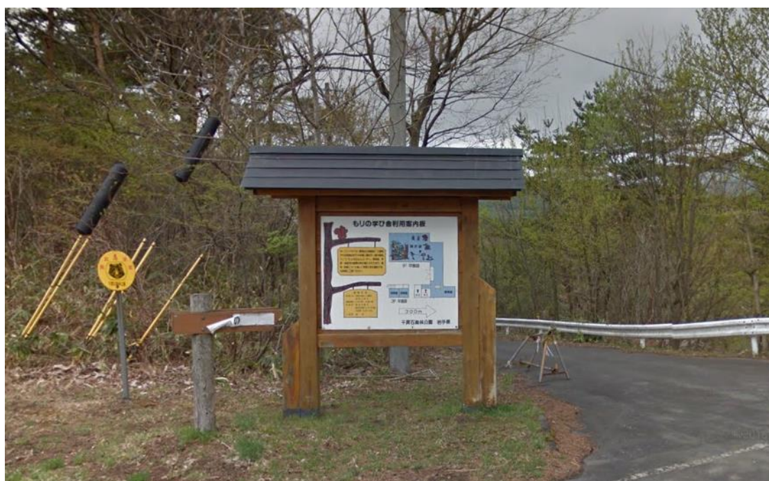
②-1 もりの学び舎側道路沿い