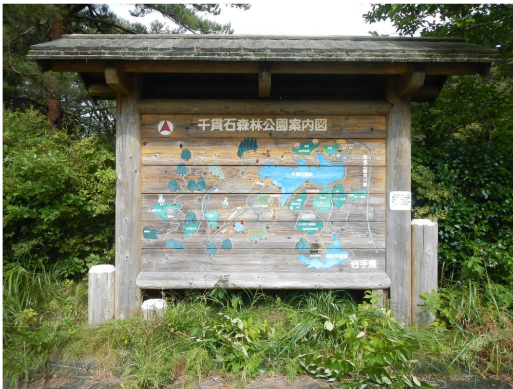
② -2 もりの学び舎駐車場