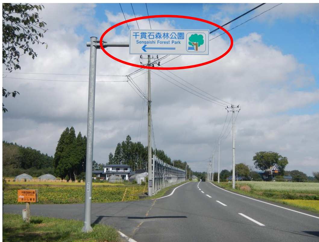
道路標識(県道 37 号線沿い 奥州市側)