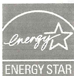
[図3] 国際エネルギースターロゴ