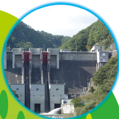
滝発電所（水力発電）