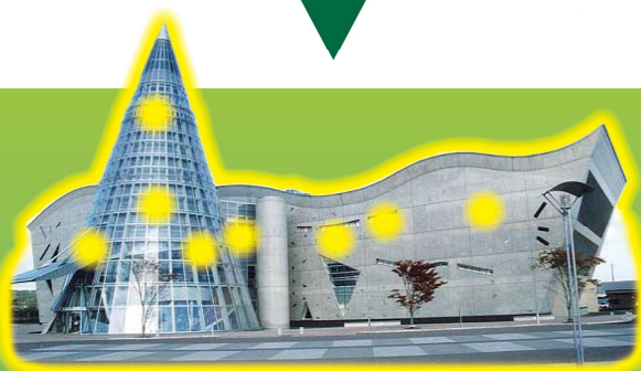
アンバーホール （久慈市文化会館）