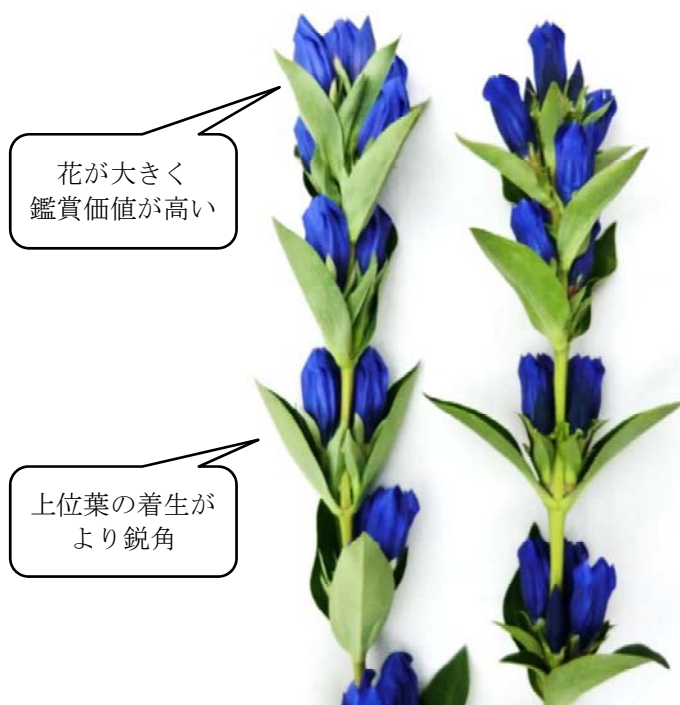
図3 草姿の特長 左：いわてLB-5号 右：いわて夢みのり