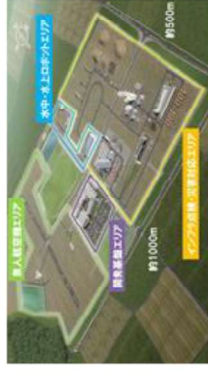
福島ロボットテストフィールド (南相馬市、浪江町)