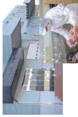
水産加工施設 (宮城県気仙沼市)