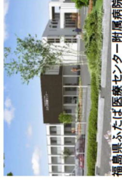
福島県ふたば医療センター附属病院 (富岡町)