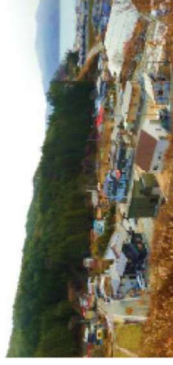
高台移転 (岩手県大槌町)