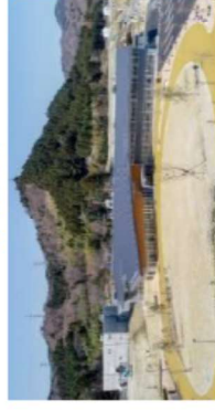
大熊町役場 (大熊町)