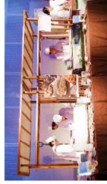
G20における被災地産食材の提供 (魚介類等)