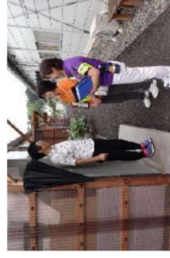
生活支援相談員による見守り活動