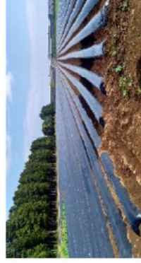
営農再開されたさつまいも の大規模農地 (楡葉町)