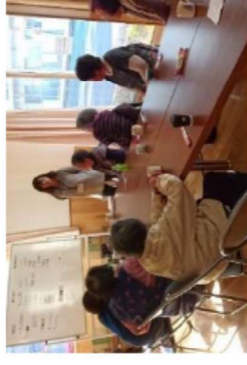
移転先での新たなコミュニティ形成に向けて

→見守り・生活相談、心身のケア、コミュニティ形成支援など、生活再建のステージに応じた切れ目ない支援を実施