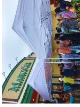
鶴住居地区の商業施設 「うのポート」(岩手県釜石市)