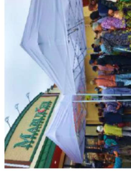
鵜住居地区の商業施設 「うのポート」(岩手県釜石市)