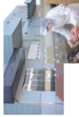
水産加工施設 (宮城県気仙沼市)