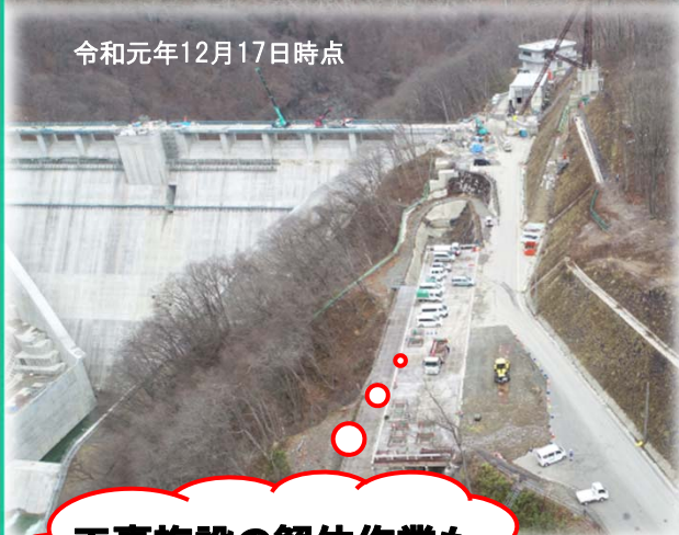
令和元年12月17日時点