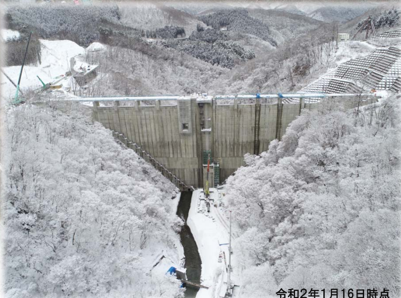
令和2年1月16日時点 (上流側より望む)