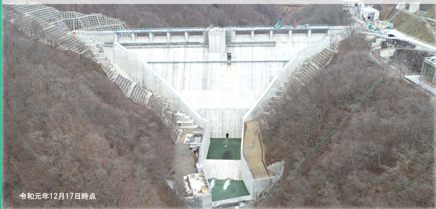
令和元年12月17日時点

築川ダム建設(堤体工)工事では、天端橋梁(ダムの上にある橋)や 監査廊(堤体内部の通路)の整備を進めています！