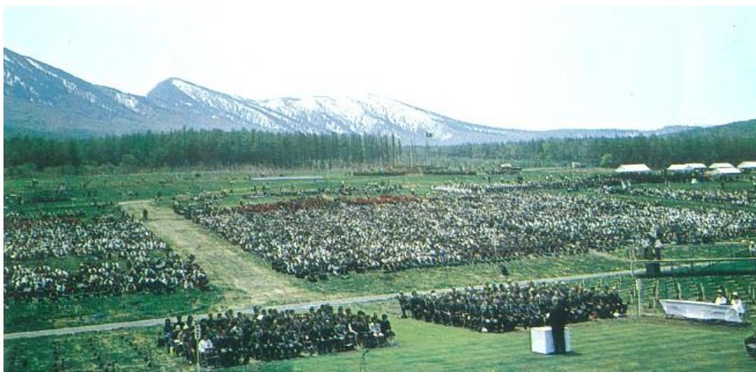
式典会場（岩手県民の森：旧松尾村）

また、お手播き行事は、植樹祭の翌日に開催され、江刺市（現奥州市）の林木育種場（現県立緑化センター）を会場に、天皇陛下が南部アカマツ、皇后陛下が南部キリの種子をお手播きされました。