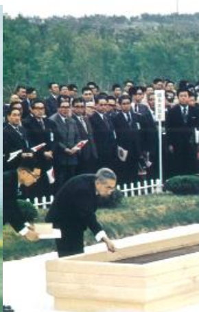
天皇陛下お手播き （南部アカマツ）