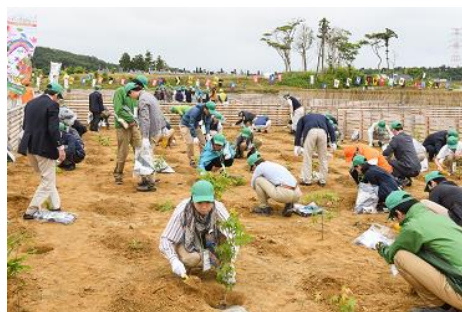
植樹会場 (第 69 回全国植樹祭〔福島県〕)