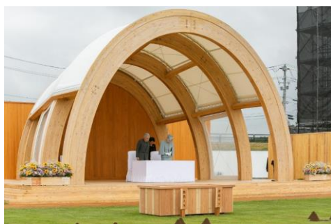
県産材を活用したお野立て所 (第 69 回全国植樹祭〔福島県〕)

ウ 式典終了後、県外招待者の皆さんには岩手県の森林・林業・木材産業や自然、文化、歴史に対する理解を深めていただけるような視察ルートを設定し、観光の振興を図ります。