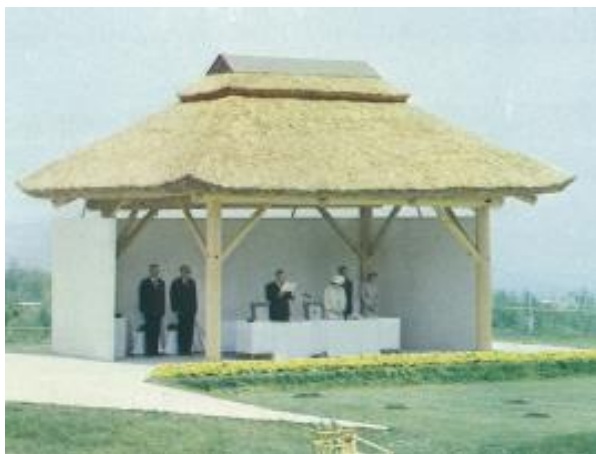
天皇陛下のおことば