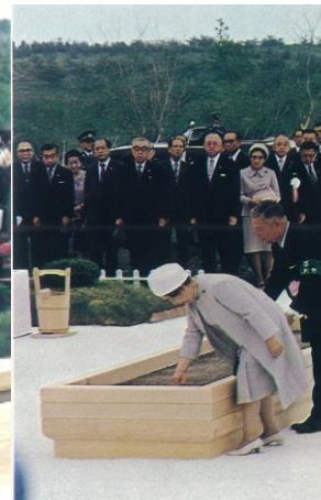
皇后陛下お手播き （南部キリ）