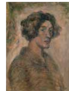
深澤省三(自画像) 1923年 東京藝術大学蔵