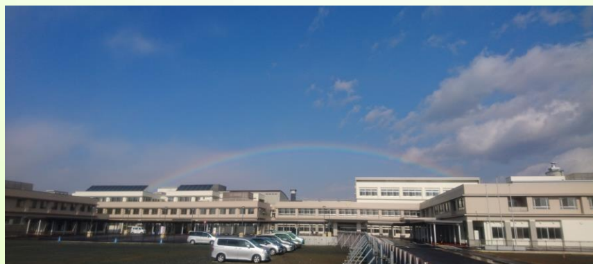
写真「県立療育センター・県立盛岡となん支援学校落成式の朝」