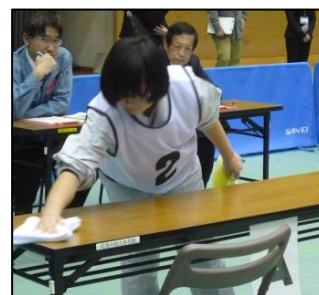
写真「特別支援学校技能認定会」