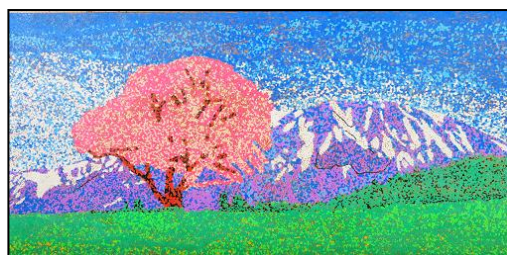
モザイク画「一本桜」