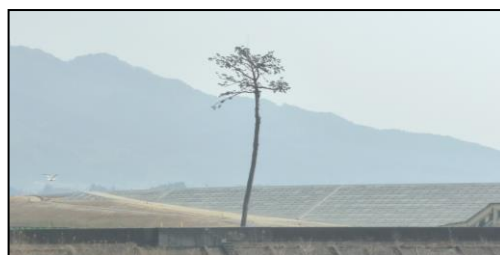
写真「奇跡の一本松 2019」

※障がい：岩手県においては、平成 20 年 4 月から、障害の「害」の字をひらがな表記に変更している。ただし、「障害者基本法」などの法令等の表記については、それぞれの法令等の表記に従って漢字表記の場合もある。本冊子においても、同様の表記とする。