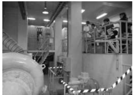
滝発電所一般公開