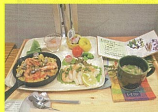
第3回全国大会優勝作品 島根県立松江養護学校 「まっようランチ」 ～地域の方とご縁に感謝を込めて～