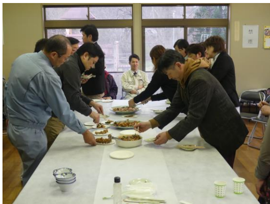
管内の集落代表者や生産者約50人が参加