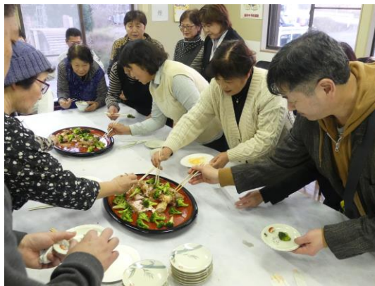
南部かしわ、仔羊、原木しいたけ等を使った料理を試食