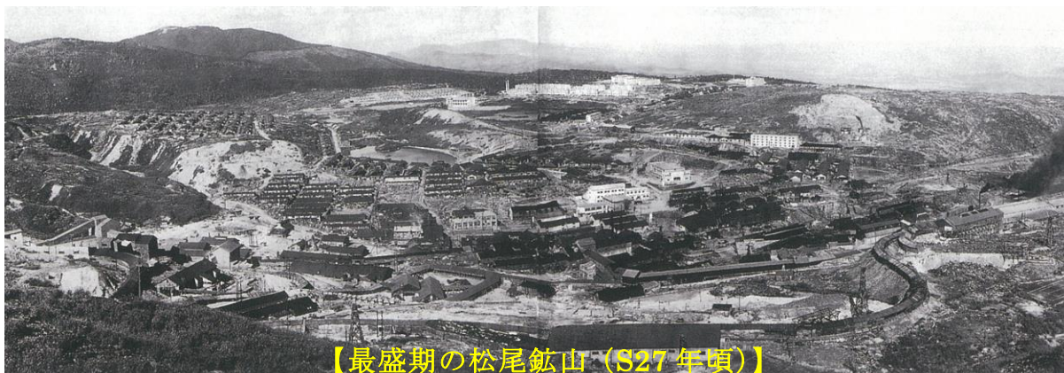
【最盛期の松尾鉱山(1927年頃)】

明治15年(1882)に いおう 硫黄 ろとう の大露頭 (※) が発見された後、明治34年(1901)から開発が進められ、大正3年(1914)に松尾鉱業株式会社が設立、本格的に操業が開始されました。埋蔵量は2億3千万トンと 東洋一の規模 を誇ったといわれています。(※ 露頭：野外で地層・岩石が露出している場所)