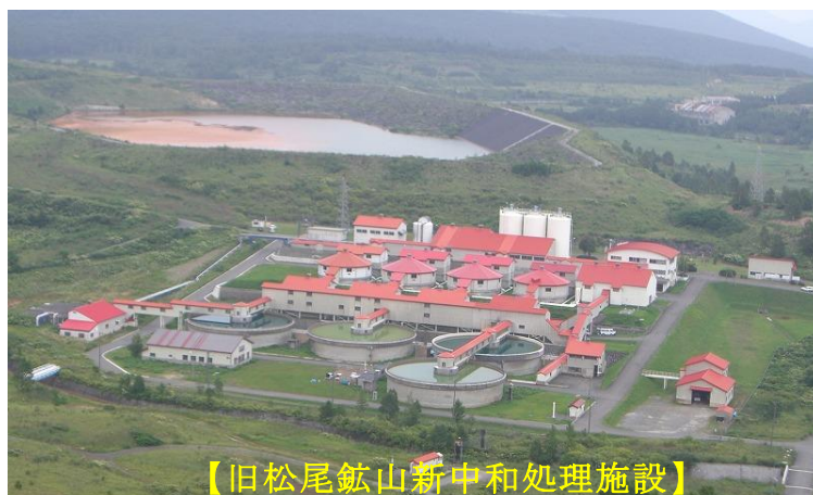
【旧松尾鉱山新中和処理施設】

五省庁会議において、旧松尾鉱山から流出する強酸性水を中和剤（炭酸カルシウム）で中和し、水質を改善するための新たな中和処理施設を旧松尾鉱山跡地に建設することが決定されました。