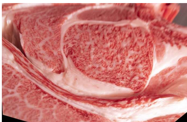
枝肉切開面 (当室画像処理)