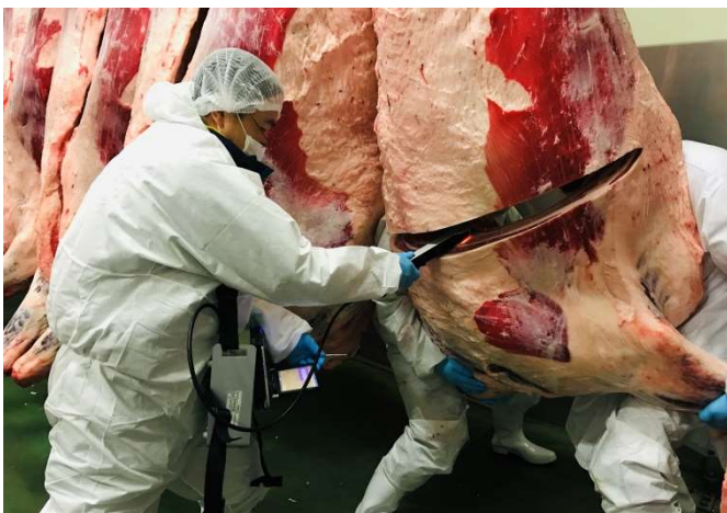
脂肪に専用の測定器をあてるだけで あっという間にMUFAの測定完了!

今後の枝肉の新たな評価として全国的に注目が集まる 一価不飽和脂肪酸(MUFA)の測定 や、脂肪交雑の形状評価へ向け ロース芯を中心とした枝肉切開面の撮影 を畜産研究所が実施しました。