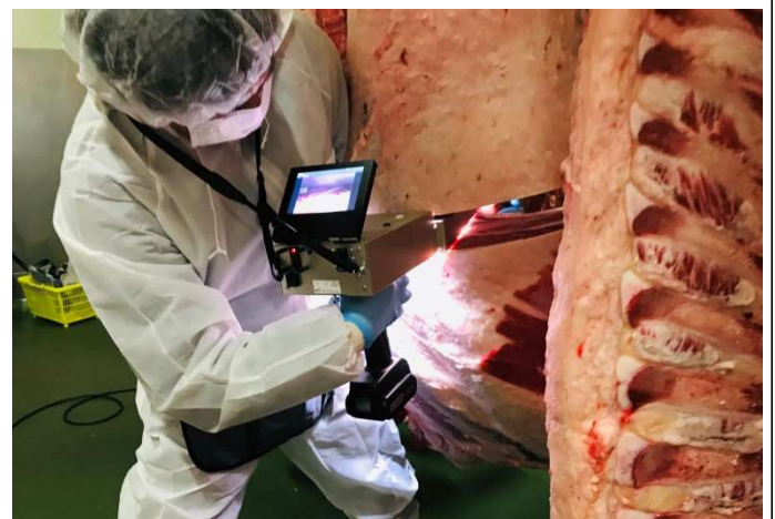
脂肪交雑の形状評価へ向け 枝肉切開面を撮影!データ蓄積中!